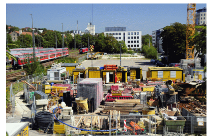
Baustelle - Materiallager