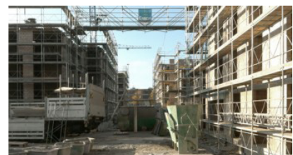
Baustelle - Rohbau