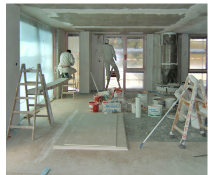
Baustelle - Innenausbau